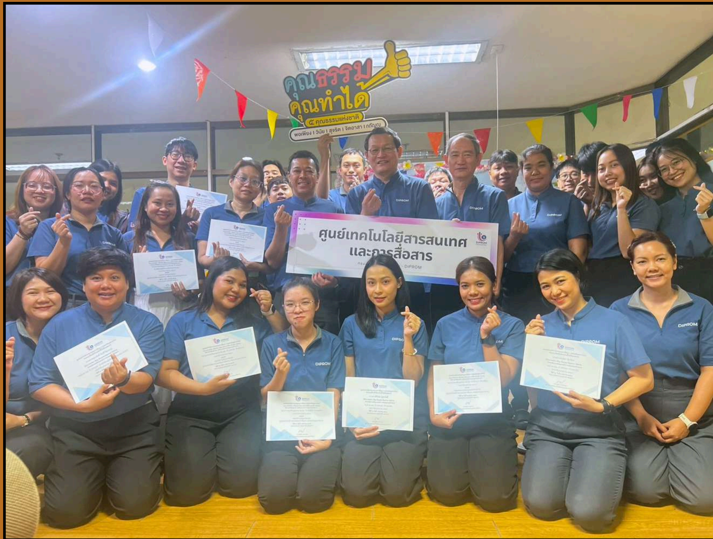
เกียรติบัตรรยกย่องเชิดชู บุคลากร ศส.ทสอ.